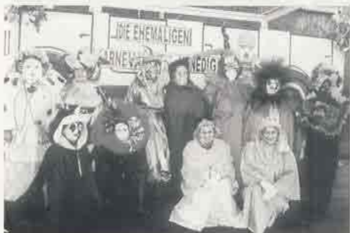
Eine Bereicherung des Uerdinger Karnevals zug sind immer wieder die ehemaligen Prinzessinnen, die im letzten Jahr unter dem Motto „Karneval in Venedig“ auftraten.