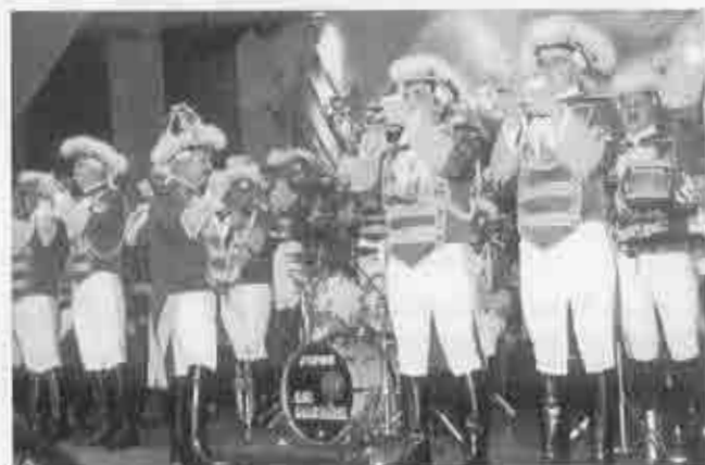
„Die Kaafsäck“ bei der Kostümsitzung