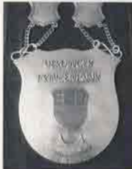
Die Prinzenkette wurde von der Firma Holtermann gestiftet.

Die Firma Holtermann fertigte in Handarbeit die beiden neuen Prinzenketten für das Uerdinger Prinzenpar wie auch für das Uerdinger Kinderprinzenpar.