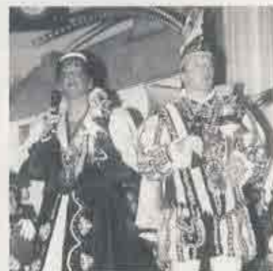
Das Uerdinger Prinzenpaar beim großen Prinzentreffen in der Rosenthalhalle in Tönisvorst.