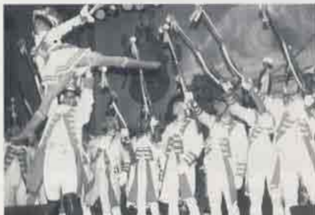
Auslöser einer karnevalistischen Diskussion über die Namensgebung der Uerdinger Halle war der Auftritt der Prinzengarde Köln mit dem Regimentsspielmannszug der Spielfreunde Uerdingen.