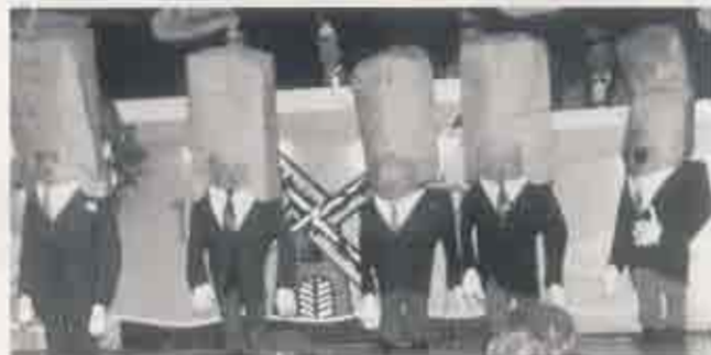
Sehr erfolgreich waren die Belly-Boys der Gruppe Enho Neman bei ihren Auftritten im Uerdinger Karneval.