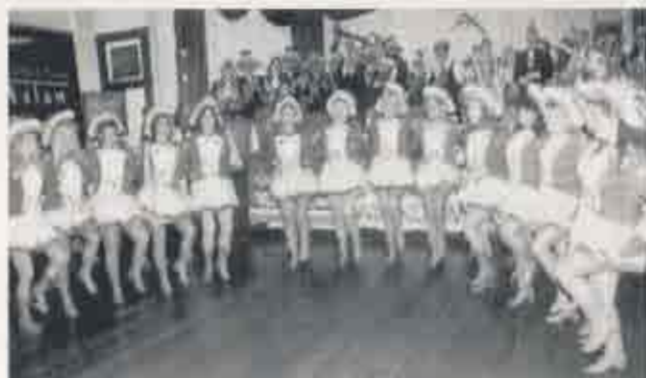
Die größte Formation beim Prinzenbiwak in Willich stellte die Prinzengarde der BNZ mit 16 Mädels.