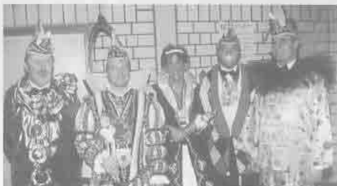
Im ungewohnten Outfit präsentierte sich das Kabinett auf der Kindersitzung der Jugendabteilung KG Op de Höh.