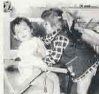
Bereits als Kleinkind knüpfte Lotar Kontakte zu weiblichen Schönheiten.