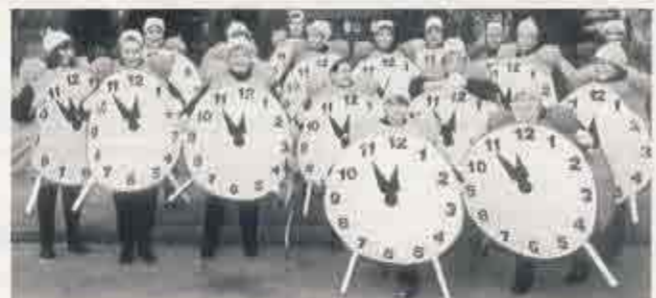
Die Frauengruppe als Wecker im Karnevalszug.