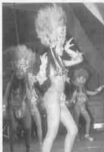
Phönix-Ballett bei der Herrensitzung