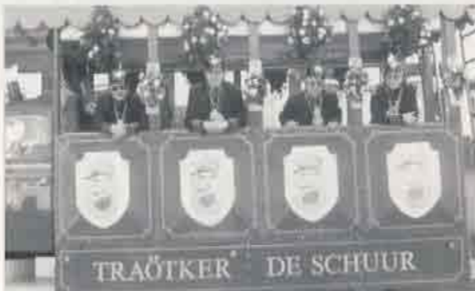
Was löschen die vier Feuerwehrmänner der BNZ?