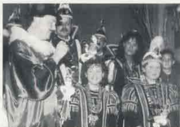
Strahlende Gesichter bei der Proklamation