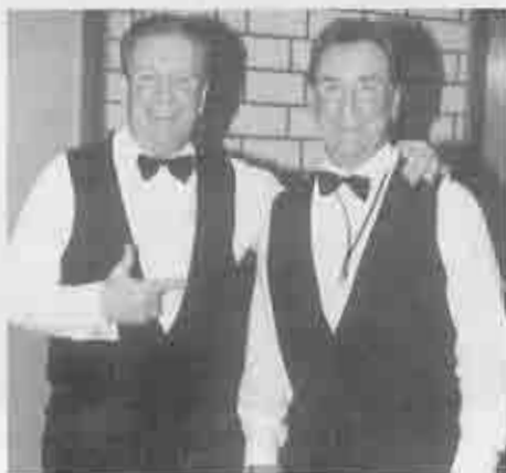
Ward Brothers bei der Kostümsitzung