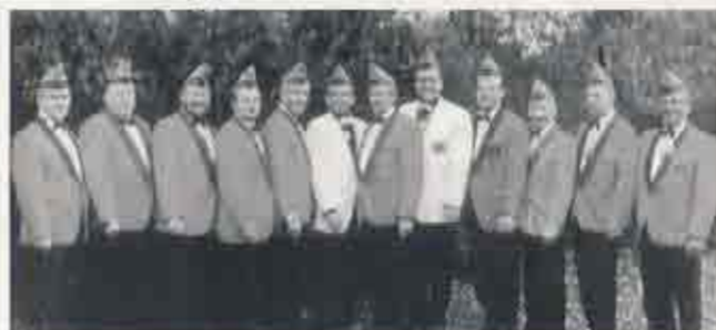
Der „zwölfköpfige“ Eiferrat im Jubiläumsjahr.