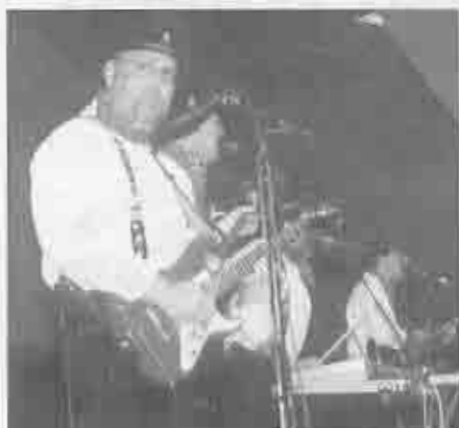
„Hätzblatt“ bei der Herrensitzung