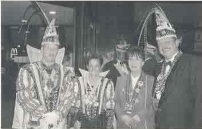
Zusammentreffen mit dem Prinzenpaar der Stadt Willich anlässlich des Gardeempfangs der Prinzengarde Willich.