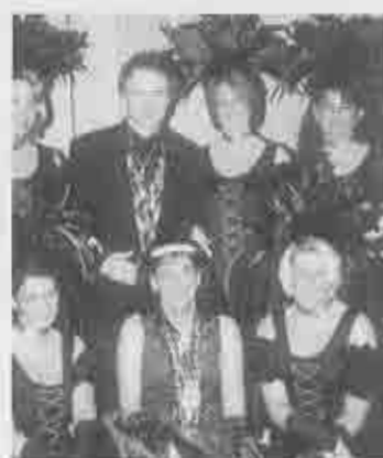
Auf allen Sitzungen der BNZ amüsierte sich das Prinzenpaar vorzüglich.