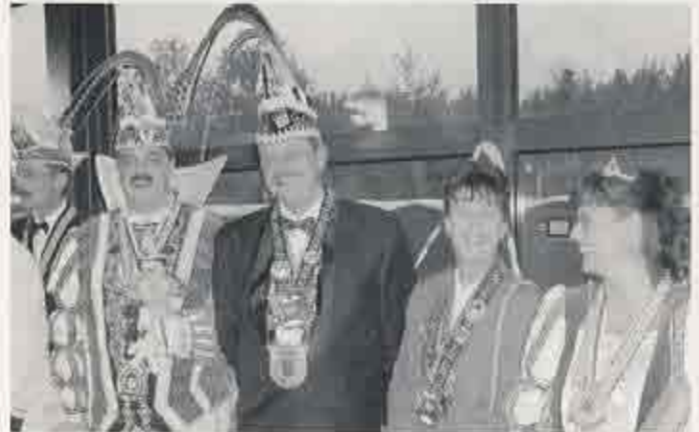
Ein erstes Kennenlernen mit dem Prinzenpaar der Stadt Tönisvorst anlässlich des Gardeempfangs der Prinzengarde Willich.