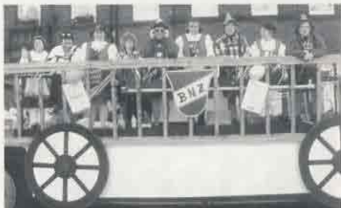
Die BNZ-Damen diesmal als „Lustige Musikanten“ bereicherten wie jedes Jahr den Uerdinger Karnevalszug.