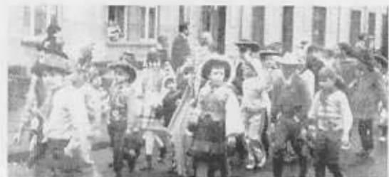
Schon früh war Prinzessin Adelgund I. im närrischen Treiben zu finden.