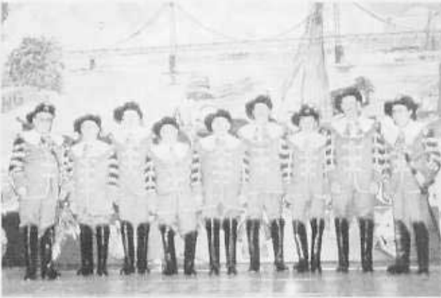
Zum 75jährigen Bestehen ihrer Gesellschaft präsentierte sich ein Teil der aktiven Mitglieder in grün-weißen Uniformen des Herzogs von Braunschweig.