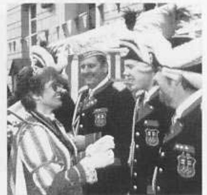
Ordensverleihung durch Adelgund I. an Ihre Leibgarde.