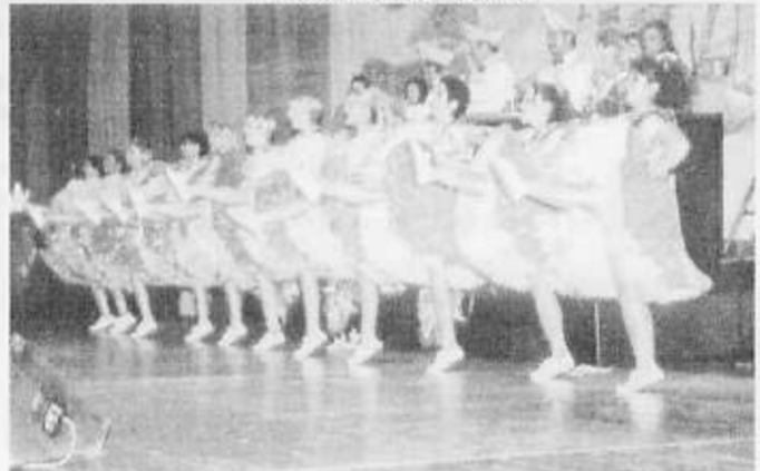
Die BNZ-Prinzengarde mit ihrem „Grease“-Showtanz 1999