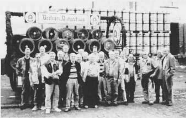
Die VUMIK vor noch vollen Fässern in der Berliner Brauerei