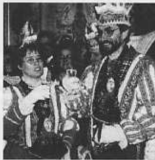
Ein erstes „Prost“ auf die Narretei.