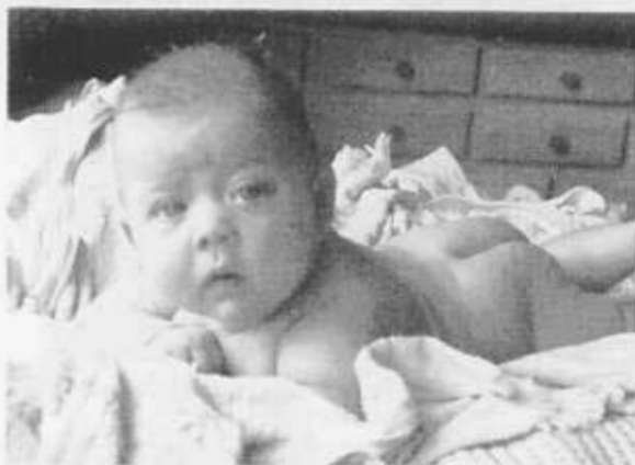
Die ersten Probeaufnahmen für den Playboy wurden von Minister Christel Cronenberg bereits in frühester Jugend angefertigt.