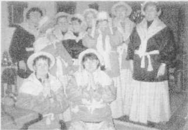
Die Marketenderinnen der BNZ-Frauengruppe beten um göttlichen Beistand für gutes, regenfreies Wetter zum Uerdinger Karnevalszug.