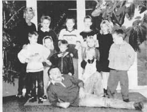
Die Kleinen der KG Eulenturm.