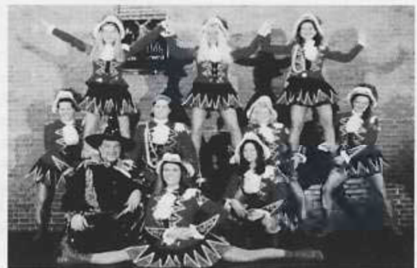
Erfolgreich mit ihren Auftritten war die Prinzengarde der KG Op de Höh auf zahlreichen Sitzungen der letztjährigen Session.