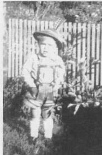
Als stammer Seppel präsentierte sich Minister Gerd Cronenberg im elterlichen Garten.