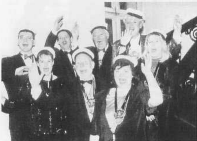
Das scheidende Prinzenpaar beförderte die als Minister fungierenden Seeoffiziere zum „Seeoffizier in Ruhe“. Als äußeres Zeichen wurde die Narrenkappe gegen eine Offiziersmütze ausgetauscht.