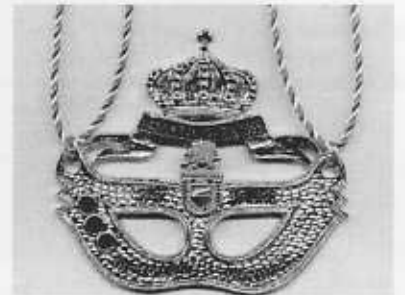
Prinzenorden der Session 1998 / 1999