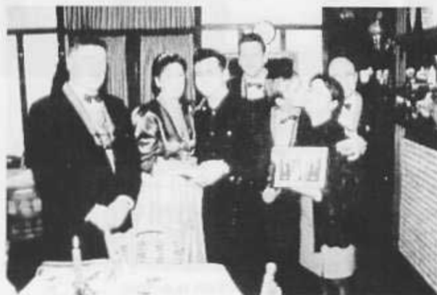
Unser Fotograf erwischte das Prinzenpaar mit Kabinett bei einem Besuch im Stadtparkrestaurant.