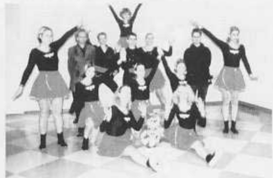
Die Showtanzgruppe der KG Eulenturm.