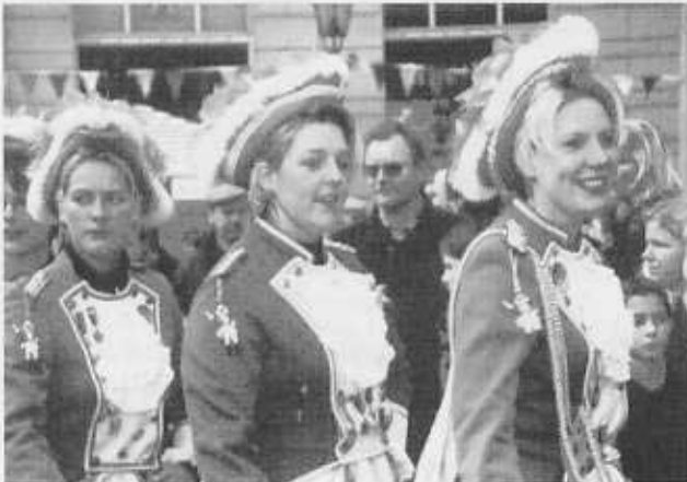
Aufzug der BNZ-Garde – teils lächelnd, teils heiter und z.T. auch ernst.

Der restliche Ablauf des Karnevalserwachens wurde von den Uerdinger Vereinen gestaltet – zum Finale spielten die Uerdinger Spielfreunde.