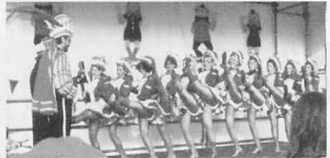
Der erste Gardetanz der Session 1999 / 2000 - nach langen, problematischen Trainingswochen sehr gut gelungen.