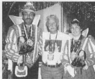
Ein Freund des Prinzenpaares aus den Niederlanden.