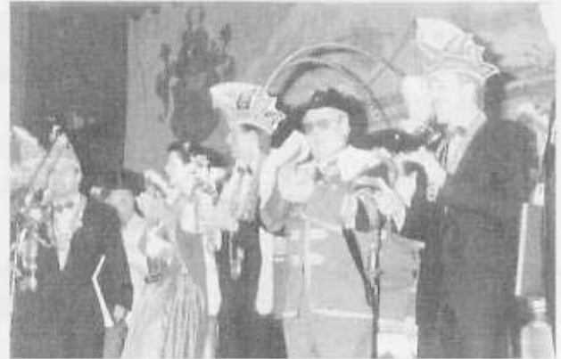
Ein Höhepunkt auf der Kostümsitzung im Jubiläumsjahr war das Erscheinen des Uerdinger Prinzenpaares mit Kabinett.