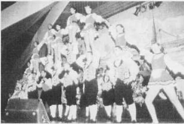
Das Kölner Traditionschorps „Kammerkätzchen und Kammerdiener“ begeisterte mit akrobatischen Tänzen.