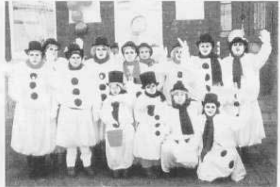
Die „Draufgänger“ - eine recht junge, aber aktive, Gruppe im Uerdinger Karneval. Beim Karnevalszug 1999 nahmen sie als Schneemänner teil.