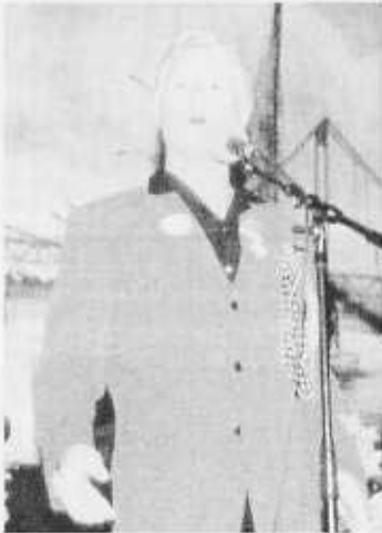
Guido Cantz – „Der Mann für alle Fälle“ – begeisterte bei der Damensitzung mit einer spritzigen Rede.