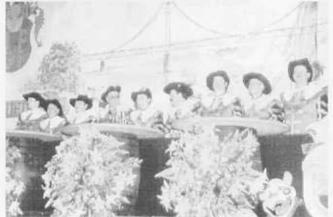
Ein farbenfrohes Bild bot der Elferrat der BNZ in seinen historischen Uniformen vor der Kulisse der Uerdinger Rheinbrücke.