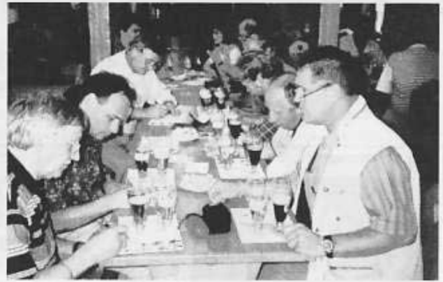
Ob die Mitglieder der VUMIK in vorgerückter Stunde hier einen Aufnahmeantrag zur Prinzen гарде Berlin unterzeichnen?