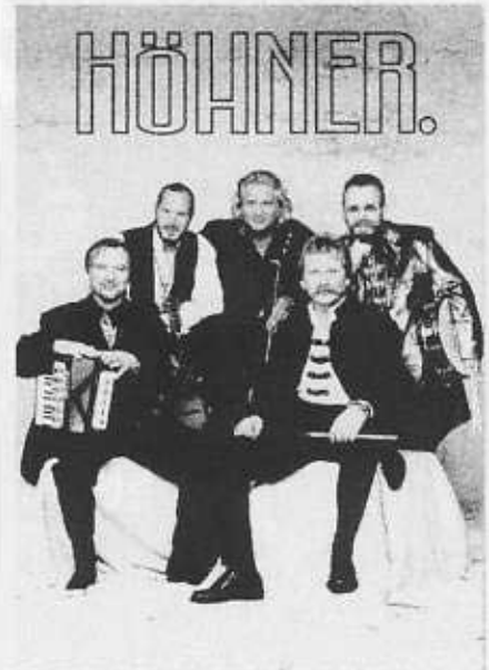
Die Karavane in der Uerdinger Halle