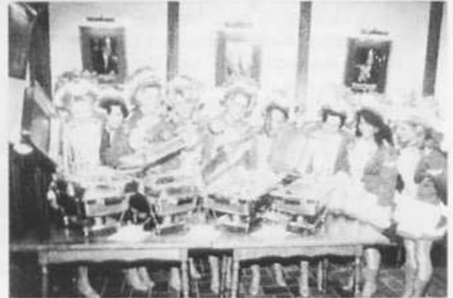
Die Damen der BNZ-Prinzengarde begutachten das Jubiläumssbuffet.