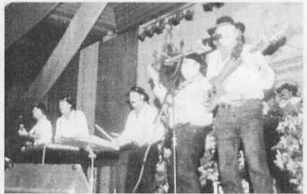
Die Kölner Gesangsgruppe „Hätzblatt“ brachte Stimmung in „die Bude“.