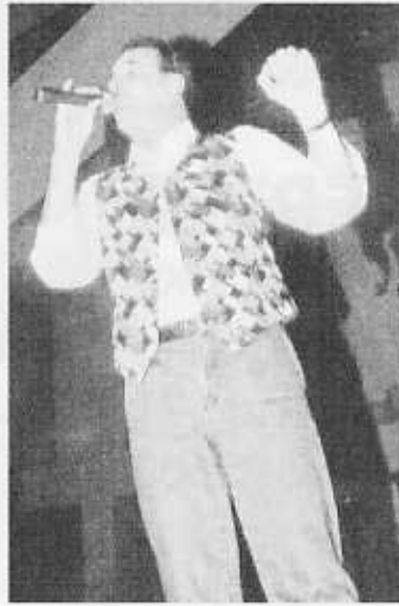
Die Kolibris sogten bei der Damen- und Herrnsitzung für Stimmung.