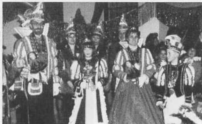
Die Uerdinger Prinzenpaare der Session 2000.