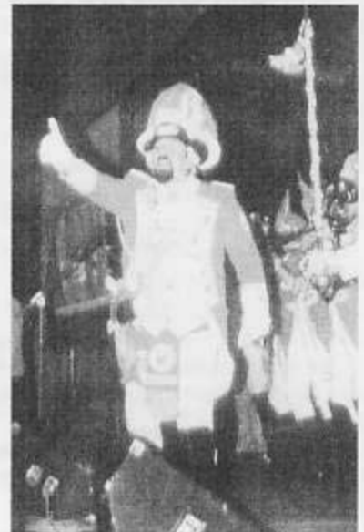
Schon zu Beginn der Kostümsitzung brachte „Bärchen“ – Kommandeur der Funken Rot-Weiß Gleuel den Saal zum toben.