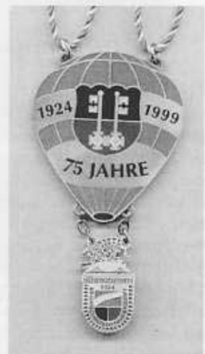
Jubiläumssorden der BNZ 75 Jahre

Für den Piratenball am 26.02.2000 in der Uerdinger Halle wurden verpflichtet: die Goombay Dance Band und die Tanzkapelle Jet Black.