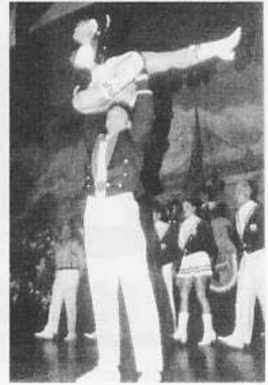
Das Kölner Tanzcorps „Original Matrosen vom Müllemer Böötche“ zeigte akrobatische Tänze.