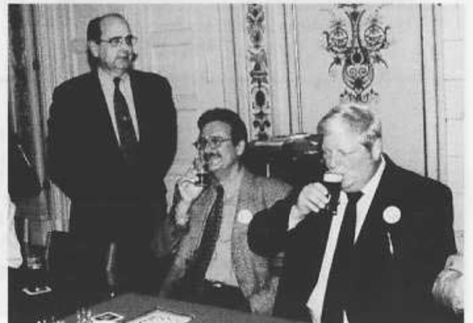
„Kopf, Hals und Bauch“ des Uerdinger Rathauses.