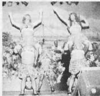
Die „Geyener Stadtpöppcher“ – ein Männerballett mit Format.