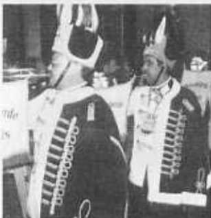
Aufzug der Prinzengarde Tönisvorst