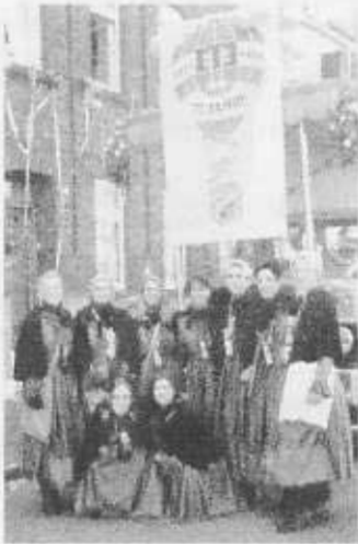
Die BNZ-Prinzengarde – im Zug in historischen Kostümen.