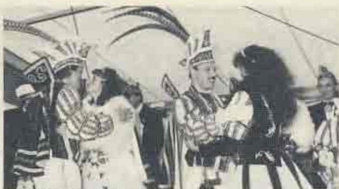
Intensiver „Gedankenaustausch“ zwischen dem Uerdinger und St. Töniser Prinzenpaar auf dem Närrischen Markttag.