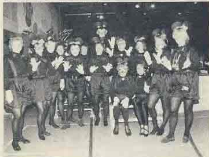
Die Damen der VUMIK (Vereinigung Uerdinger Minister im Karneval) formierten sich vor drei Jahren zu einer närrischen Frauengemeinschaft. Seit dieser Zeit treffen sie sich einmal monatlich zu einem geselligen Essen, wobei das Erzählen naturgemäß nicht zu kurz kommt. Daß aber auch karnevalistische Aktivitäten auf der Tagesordnung stehen, zeigt sich daran, daß sie an den Veranstaltungen mit selbst erdachten und geschneiderten fantasievollen Kostümen teilnahmen.