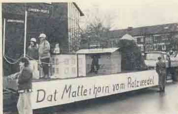
Ein zurecht unzumutbares Projekt an der Arndtstraße wurde von der KG Op de Höh treffend mit Ihrem Wagen im letzten Karnevalszug glossiert.