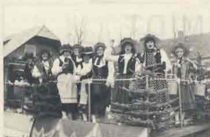
Einer der oft prämierten schmucken Wagen der Exprinzessinnen, der sie hier als Schwarzwaldmädel ausweist.

Karnevalisten als vorbildlich angesehen. Im Jahre 1972 nahmen die Exprinzessinnen zum ersten Mal in den Kostümen von Märkelendörfern am Uerdinger Karnevalszug aktiv teil. Seitdem sind sie nicht mehr aus dem Uerdinger karnevalistischen Geschehen wegzudenken und holten mit ihren immer sehenswerten Motivwagen - u.a. Nacht in Venedig - Ungarland - Griechen in Athen - Herz ist Trumpf - Schwarzwaldmädel - Land des Lächelns - Narrencircus - Berliner Luft - Crefeld-Uerdinger-Lokalbahn - mehrere erste Preise.