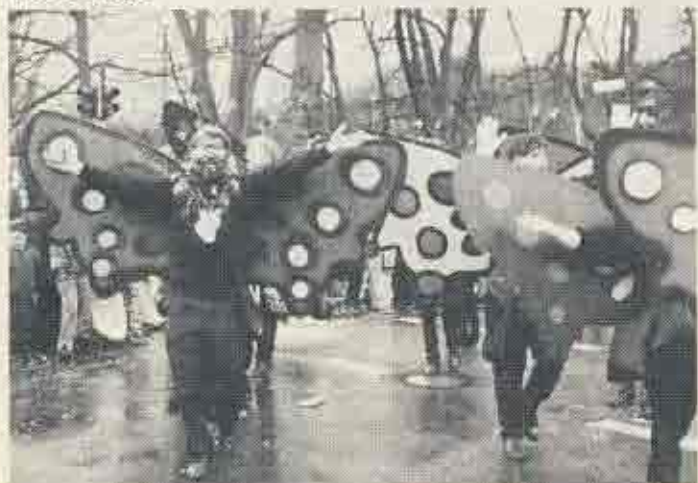
Schon fast traditionsgemäß siegten die Mannen um Theo Engels (Die lustigen Dröbelkes) beim Wettbewerb um die beste Fußgruppe im Uerdinger Karnevalszug mit dem Motto: „Schmetterlinge in Blau, Gelb, Rot - der Uerdinger Karneval is jot“.

WILFRIED PAHNKE · Wasserchemikalien Niederstraße 127 47829 Krefeld-Uerdingen Telefon 0 21 51 / 48 11 42 Telefax 48 14 92