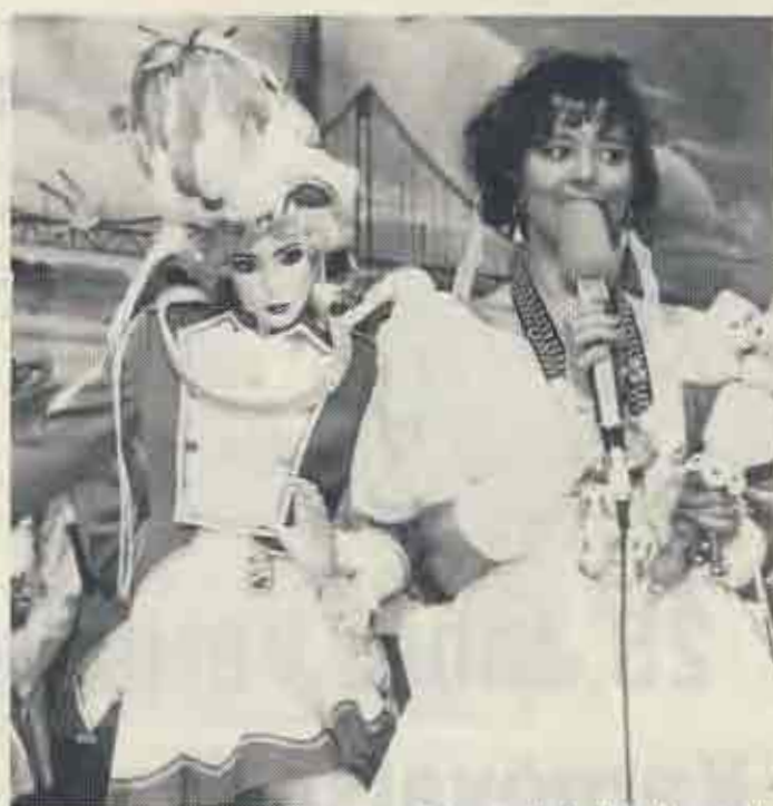
Als Abschiedsgeschenk wurde Prinzessin Bettina I. von der BNZ zum Dank für jahrelange Führung der Prinzengarde eine Puppe mit ihrer Original-Gardeuniform überreicht.