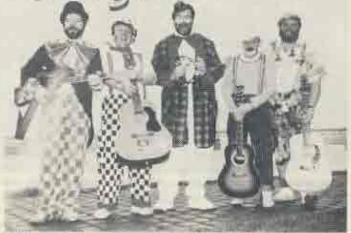
Mittlerweile überall bekannt, von Aachen bis ins Münsterland.