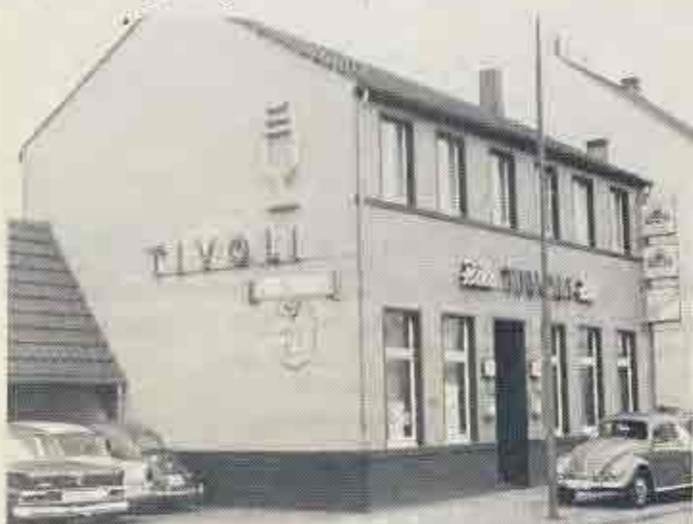
Vor genau 20 Jahren fungierte das langjährige Vereinslokal der BNZ, die Gaststätte „Im Hagschinkel“ unter der Leitung des Wirts- und Exprinzenpaars Dieter und Erika Backes, als Prinzenburg für die amtierenden Tollitäten Achim I. und Ilona I. (Krölls).

Die Braunschweiger Narrenzunft wird weiterhin aktiv an der Förderung des Uerdinger Karnevals teilnehmen in Verbindung mit ihren karnevalistischen Freunden, bei denen sie sich auf diesem Wege für ihr partnerschaftliches und freundschaftliches Verhalten herzlichst bedankt.