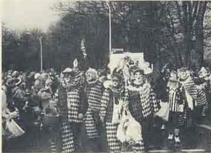
In farbenfrohen Clownkostümen präsentierte sich der Moppeclub als jüngste Uerdinger Karnevalsgesellschaft.