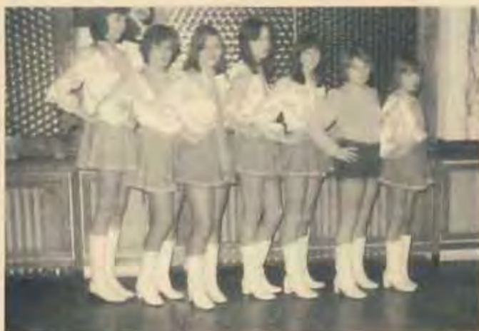
Uerdinger Prinzessinnen am Karnevalssonntag 1975 als Marketenderinnen vor dem Rathaus.